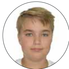
Фас до начала лечения