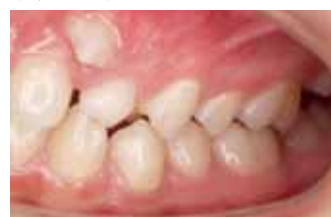
Прикус боковой проекция слева до начала лечения