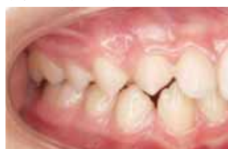
Прикус боковой проекция справа до начала лечения