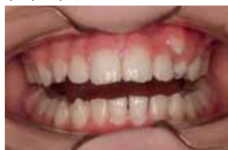
Приоткрытый рот до начала лечения