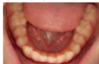
Форма нижнего зубного ряда до начала лечения