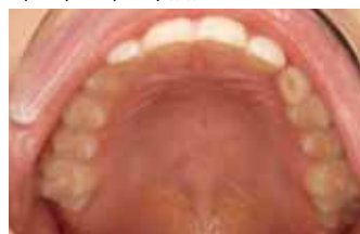
Форма верхнего зубного ряда до начала лечения