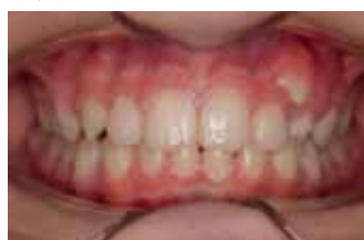
Прикус проекция фас до начала лечения