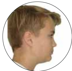
Профиль до начала лечения