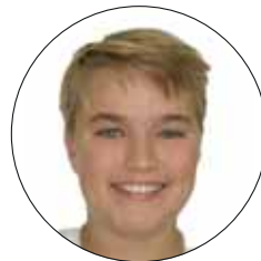
Улыбка до начала лечения